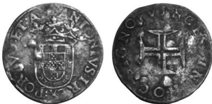
Ag - 7,01 g - 29 mm (schaal 150%)

We denken dat de onderstaande vondstmunt zeker voldoet aan onze definitie van 'bijzonder':